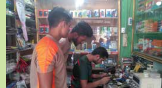
ঝড়ে পড়া কিশোরদের মোবাইল সার্ভিসিং-এর প্রশিক্ষণ

দাতাসংস্থা- KFW-BRAC। কর্মকাণ্ড শুরু- আগস্ট ২০২৩ থেকে মে ২০২৪। কর্মএলাকা-পটুয়াখালী জেলার গলাচিপা উপজেলা। অংশীজন-১৫০ জন।