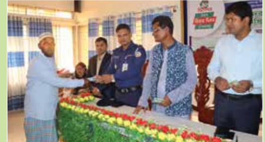
কৃষককে সূর্যমুখী প্রকল্পের আওতায় নগদ অর্থ সহায়তা প্রদান করছেন পাথরঘাটার খানার ভারপ্রাপ্ত কর্মকর্তা

এসডিজি লিঙ্কেজ: এসডিজি গোল-২, লক্ষ্য-২.৪ সূচক-২.৪.১। উল্লেখযোগ্য অর্জন : ক) ক্ষুদ্র চাষীদের প্রশিক্ষণ ৮ ব্যাচ, খ) হাইসান ৩৬ জাতের ৪৫০ কেজি বীজ প্রদান, গ) মাঠ দিবস আয়োজন ৪টি, ঘ) তৈল পরিশোধন মেশিন স্থাপন ১টি, ঙ) ক্ষুদ্র চাষীদের অর্থ সহায়তা প্রদান ১৯,৬৫,০০০ টাকা।