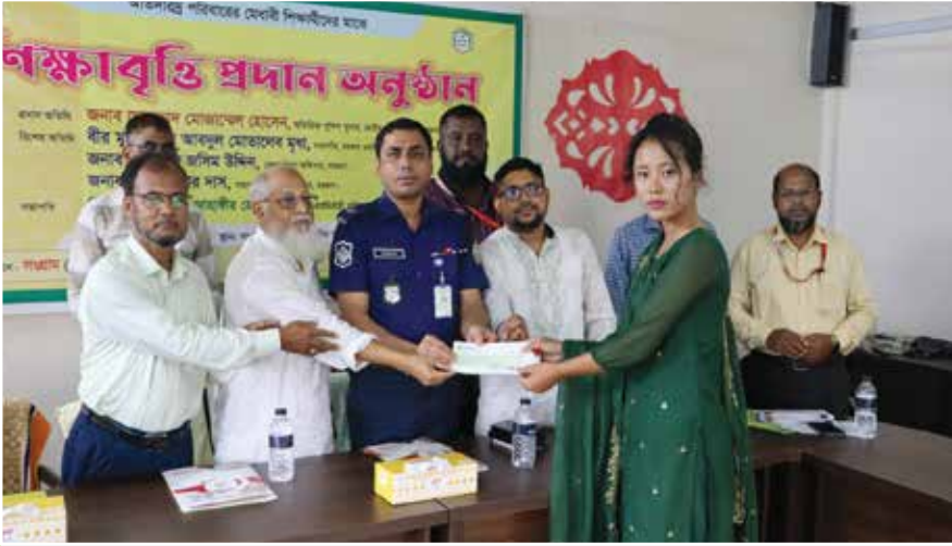
রাখাইন শিক্ষার্থীকে চেক তুলে দিচ্ছেন বরগুনার অতিরিক্ত পুলিশ সুপার