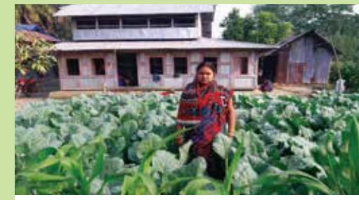
জাগরণ ঋণের সদস্য ঘরের আড়িনায় বছরব্যাপী সবজী চাষি

অর্থ প্রদানকারী সংস্থা: পিকেএসএফ ও বিভিন্ন ব্যাংক। বাস্তবায়নাধীন এলাকা: বরিশাল বিভাগের সকল জেলাসমূহ। মোট ঋণ প্রকল্প-৯টি (বুনিয়াদ, জাগরণ, অগ্রসর, সুফলন, আইজিএ, এসিএল, এলআইএল, এসপি, এলআরএল)। ঋণ শাখা-৫০ টি। সমিতি- ২ হাজার ৬৯৩ টি। মোট সদস্য-৯৯ হাজার ২১২ জন। মোট ঋণী-৪২ হাজার ৭৯৫ জন। এযাবৎ ঋণ বিতরণ : ১৮০৫.৪০ কোটি টাকা। বর্তমান ঋণস্থিতি: ১৬১.৬১ কোটি টাকা। আদায়ের হার-৯৯%। সঞ্চয় স্থিতি: ৪৫ কোটি ১৯ লক্ষ ৬৯ হাজার ৭৮৯ টাকা।