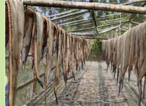
আট ফুট উঁচু গিন মাচায় মাছ শুকিয়ে গুঁটকি তৈরি করা হচ্ছে।

উল্লেখযোগ্য অর্জন : ক) দ্বিকক্ষবিশিষ্ট উঁচু লেট্রিন ৬টি খ) গভীর নলকূপ ৬টি গ) গুঁটকির উচ্ছিন্ন দিয়ে গো-খাদ্য তৈরি মেশিন ২টি ঘ) ভ্যাকুয়াম প্যাকেজিং মেশিন ২টি ঙ) ফিশ ড্রায়ার ২টি চ) গিন মাচা ৮টি ছ) ফিশ ফাইন্ডার ২২টি জ) নারী শ্রমিকদের বিশ্রামাগার ৭টি ঝ) ব্রেস্ট ফিডিং কর্নার ১টি ঞ) নিরাপদ গুঁটকি বিক্রয়কেন্দ্র স্থাপন ১টি।