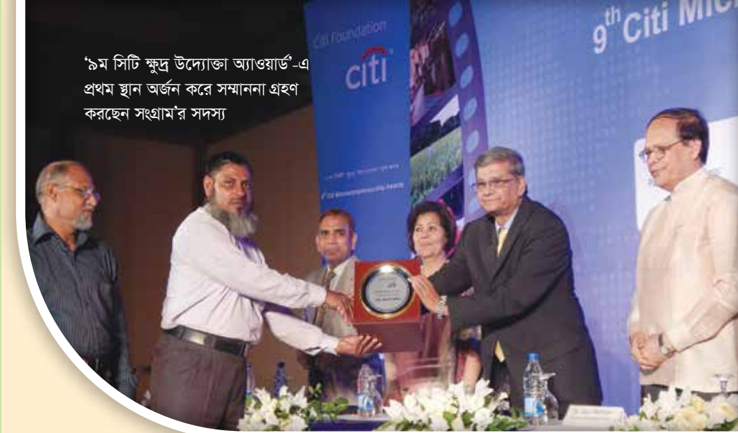
৯ম সিটি মাইক্রো উদ্যোক্তা অ্যাওয়ার্ড-এ প্রথম স্থান অর্জন করে সম্মাননা গ্রহণ করছেন সংগ্রাম'র সদস্য

প্রধান কার্যালয়: ৬৫, শহীদ স্মৃতি সড়ক, বরগুনা ঢাকা অফিস: জেনেটিক ওয়েস্ট উড, বাড়ী-২৮৪/২৮৫, রোড-২, আদাবর, ঢাকা ফোন: +৮৮ ০২৪৭৮৮৮৬৮২৮, +৮৮ ০১৭৩৩৩৪৭৯৩৩ ই-মেইল : contact@sangram.ngosangramngo@yahoo.com facebook.com/ngosangram youtube.com/Sangram Ngo