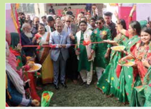
বরগুনায় উদ্যোক্তা পণ্য প্রদর্শনীর শুভ উদ্বোধন করছেন জেলা প্রশাসক মহোদয়

সহযোগিতায়: পল্লী কর্ম-সহায়ক ফাউন্ডেশন (পিকেএসএফ)। কার্যক্রম শুরু : ৮ মার্চ ২০২৩ থেকে ৩১ ডিসেম্বর ২০২৩ পর্যন্ত। বাস্তবায়নাধীন এলাকা: বরগুনা, পটুয়াখালী, পিরোজপুর জেলা। লোকবল: ১জন। অংশীজন : ১০০০ জন উদ্যোক্তা।