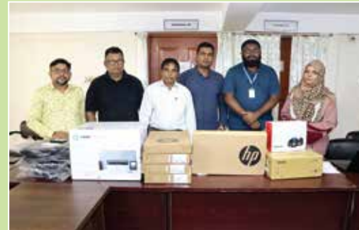
প্রকল্পের আওতায় আইসিটি মাল্যমাল গ্রহণ শেষে সিডিডি'র কর্মকর্তা সাথে সংগ্রাম'র নির্বাহী পরিচালক ও অন্যান্য

কর্মকৌশল: প্রত্যন্ত অঞ্চলে ঝুঁকিপূর্ণ কমিউনিটির উন্নয়নে কাজ করে MIVA এবং Liliane Foundation তাদের সাথে অংশীদারত্বের ভিত্তিতে স্থানীয় উন্নয়ন সহযোগি সংস্থাকে পরিবহণ ও যোগাযোগ সরঞ্জাম প্রদান। অনুদান : ০৫টি মোটর সাইকেল, ০৫টি ল্যাপটপ, ০১টি লেজার প্রিন্টার, ০১টি মাল্টিমিডিয়া প্রজেক্টর ও ১টি ক্যামেরা।