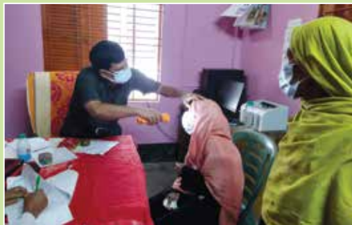
চক্ষু চিকিৎসা প্রদান করছেন বিশেষজ্ঞ ডাক্তার

এবং ১৭,৭৫৪ জন রোগীর চোখের চিকিৎসা প্রদান করা হয়েছে।