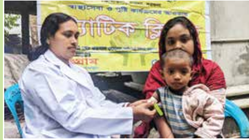
স্ট্যাটিক ক্লিনিকে মোয়াক টেপ দিয়ে পুষ্টি পরিমাপ